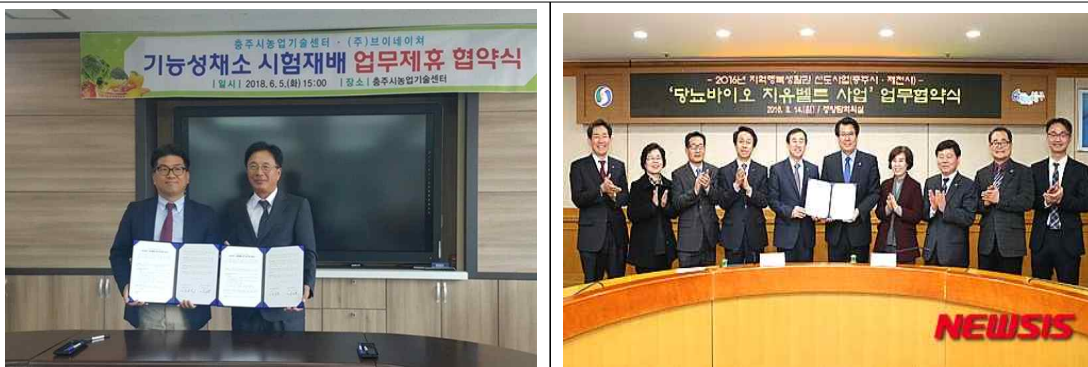
건강을 컨셉으로 다양한 바이어 기업 유치와 지원 사업을 전개