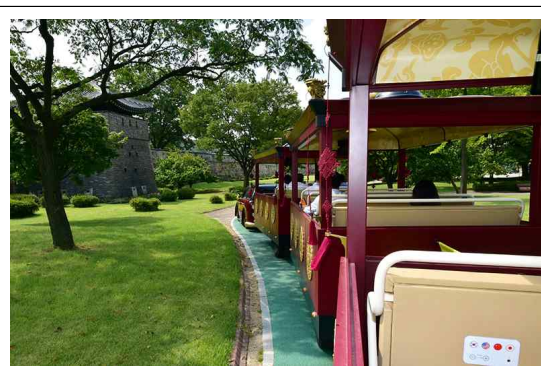
수원화성 어차 운영 모습