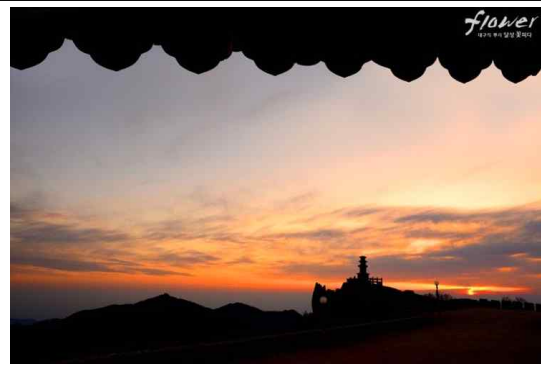
대구달성 석양관광전기차 운영 모습