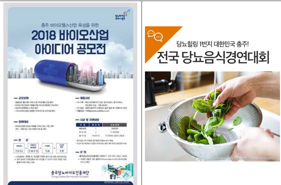
당뇨바이오를 지역 전략산업으로 선정하고, 특화산업 육성 및 대외적으로 브랜드 이미지 제고를 위해 다양한 노력 전개