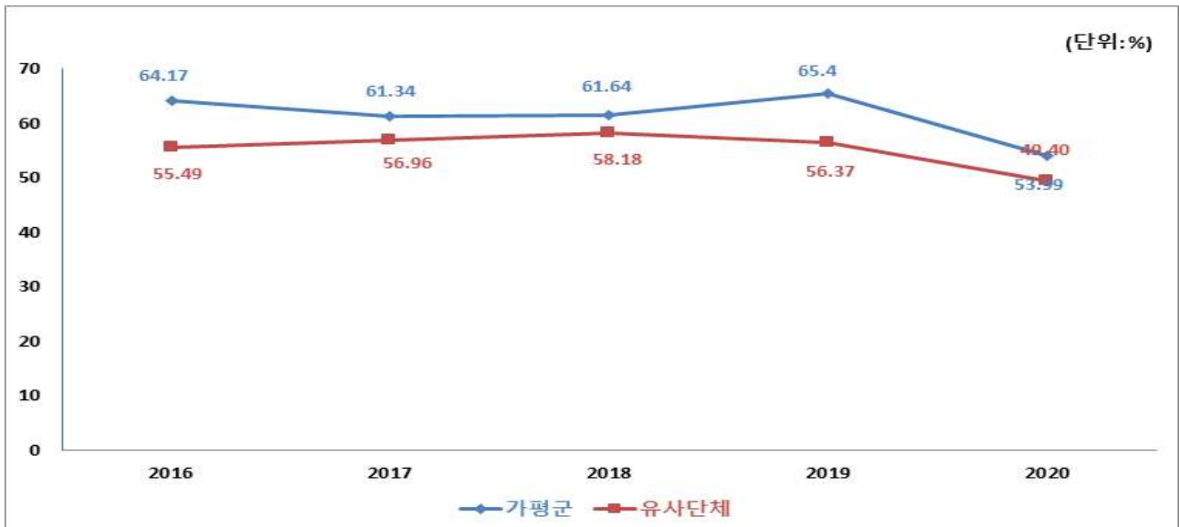
유형 지방자치단체와 재정자주도 비교