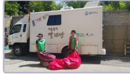
이동 빨래방 봉사활동